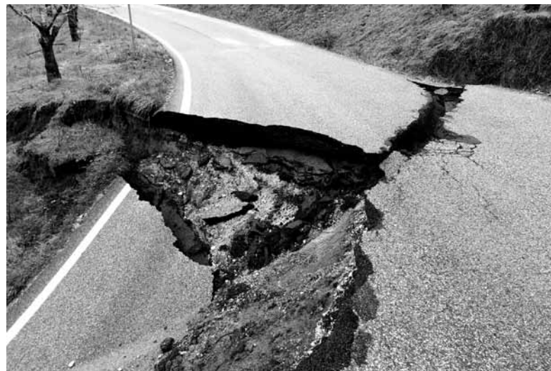
Un territorio che frana, da difendere

La storia recente parla da sola. La guerra “infinita” e quella “umanitaria” non hanno portato pace ma alimentato i conflitti interni in Afghanistan, in Iraq come in Libia e, semmai, hanno dato ossigeno a quei fondamentalismi che, cavalcando e alimentando lo scontro con l'occidente, sperano di estendere il proprio controllo su quei territori.