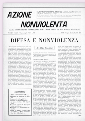
An giugno-luglio 1968

La Campagna è, dunque, una grande prova organizzativa, politica e culturale del movimento per la pace. A 100 anni dalla “grande guerra”, che ha segnato il passaggio moderno e definitivo alla guerra tecnologica, è giunto ormai il tempo di passare dalla retorica della pace, che prepara sempre nuove guerre, alla politica per la pace che ne prepara e costruisce la difesa. Che essendo “civile, non armata e nonviolenta” ha bisogno della partecipazione di tutti, a cominciare dall’impegno di ciascuno nella raccolta delle firme necessarie.