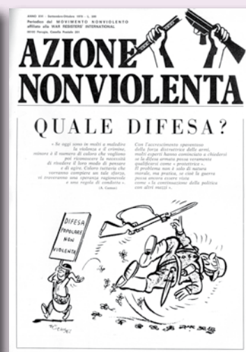
An settembre-ottobre 1979