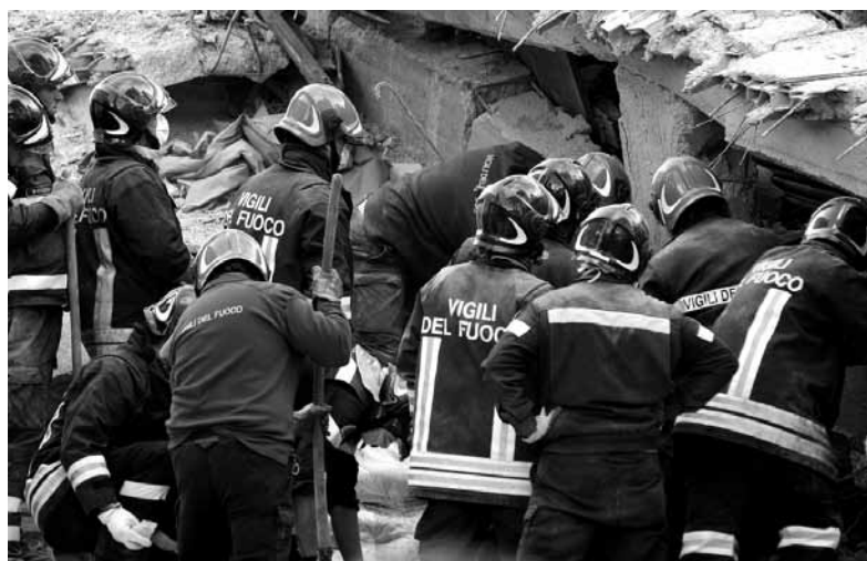
Interventi di difesa della Guardia Forestale e dei VV FF