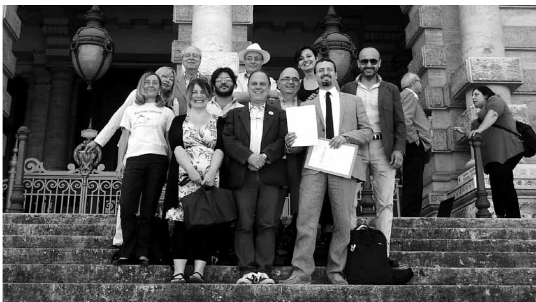
I rappresentanti delle Reti, davanti alla Corte di Cassazione dove è stato depositato il Progetto di Legge, 3 luglio 2014