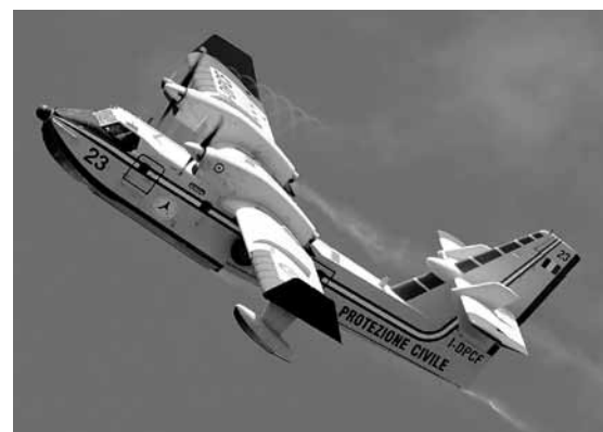
Difesa dagli incendi

La Cnesc, attraverso le proprie organizzazioni sociali, si impegna a sensibilizzare i giovani che stanno svolgendo il Servizio Civile Nazionale durante i mesi per la raccolta delle firme.