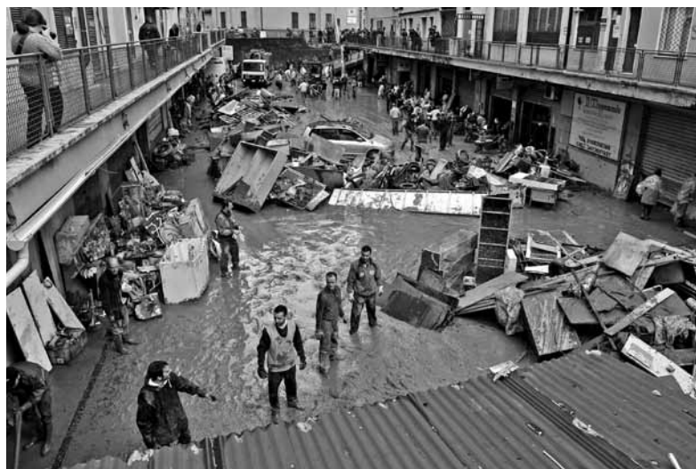
La recente alluvione di Genova

Il secondo aspetto da tenere presente riguarda la tempistica di questa proposta. Secondo le Reti promotrici la Campagna “Un’altra Difesa è possibile” arriva al momento giusto nella dinamica di attenzione che l’opinione pubblica ha sviluppato negli ultimi anni su temi come la spesa militare, il concetto di difesa, l’efficacia dello strumento militare (in varie declinazioni). Il successo di diverse mobilitazioni disarmiste e dell’azione concreta e approfondita dei gruppi pacifisti ha portato ad una sensibilità molto alta, negli ultimi tempi. Ed è quindi importante poterla subito intercettare con una proposta che renda concrete le richieste di Pace da tempo rilanciate dai nostri gruppi ed associazioni, anche se in maniera evocativa e generale. In questo senso l’elemento di un primo grezzo meccanismo di opzione fiscale, che permetta al singolo cittadino di destinare una porzione delle proprie tasse alla Difesa civile e non armata, è davvero rilevante. Proprio perché fornisce a ciascuno di noi uno strumento concreto e pratico con cui muoversi, una possibilità efficace e semplice di sostenere una visione diversa di quel dovere costituzionale alla Difesa sancito dall’articolo 52 della nostra Carta fondamentale.